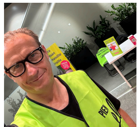
Tunnelmia äänestyspaikkojen keräyspaikoilta