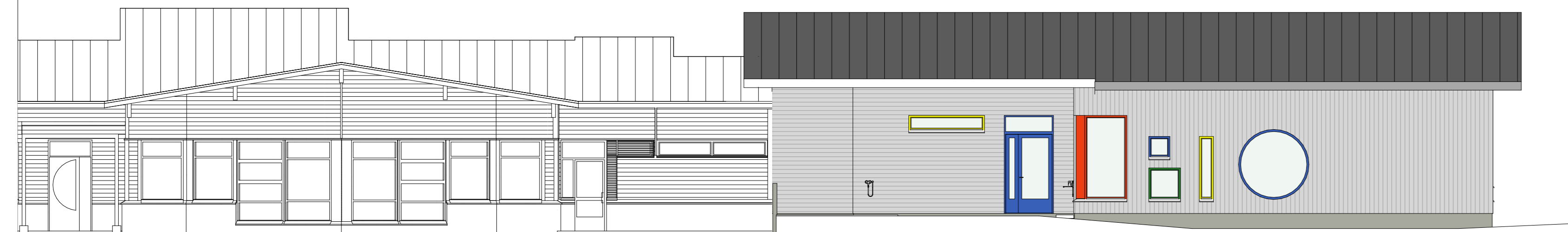
Julkisivu kaakkoon (katoksen alla)