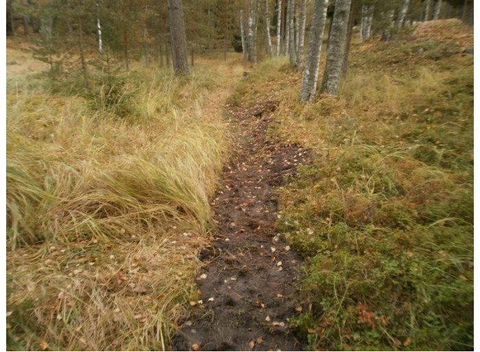
Bild 3a-b. Dike nr 4 & 5 var igenfyllda Kuva 3a-b. Ojja nro 4 & 5 oli täytetty