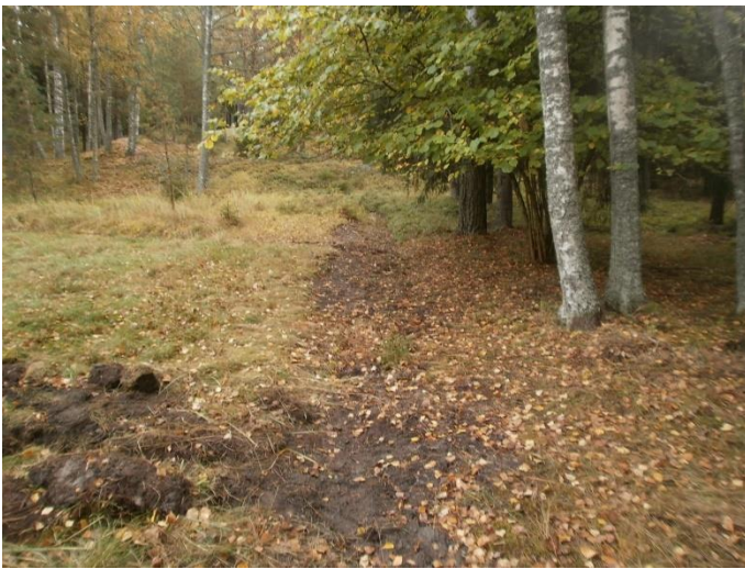
Bild 4. Rådiket nr 6 Kuva 4. Rajaoja nro 6