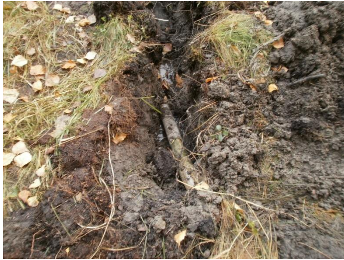
Bild 1a-b. Igenpluggat dräneringsrör i dike nr 2 Kuva 1a-b. Tulpattu salaojaputki ojassa nro 2