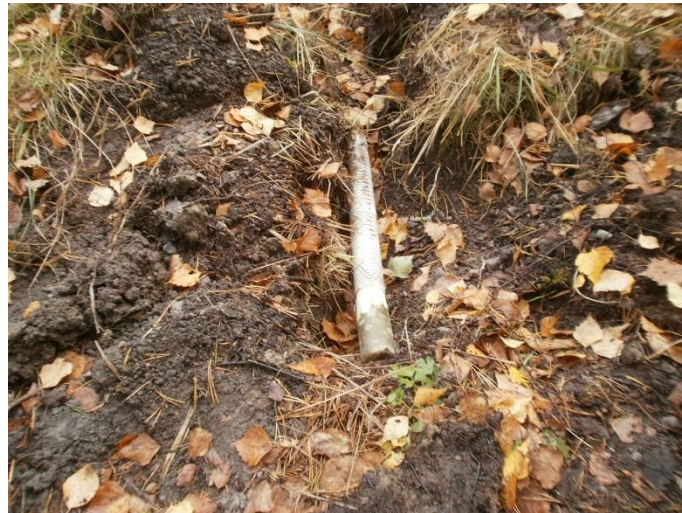
Bild 2a-b. Igenpluggat dräneringsrör i dike nr 3 Kuva 2a-b. Tulpattu salaojaputki ojassa nro 3