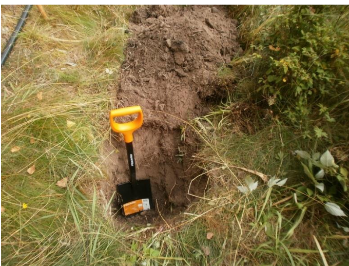
Bild 7a-b. Dolt dräneringsrör i dike nr 1