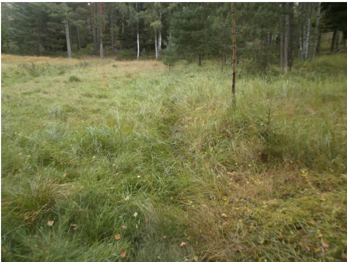
Bild 5-6. Dike nr 4 & 5 var inte igenfyllda