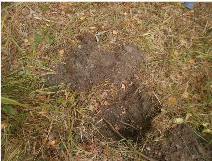
Kuva 1a-b. Tarkastuskuoppa rajaojassa