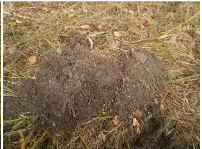
Bild 2a-b. Kontrollgrop i skogskanten nedanom rådiket