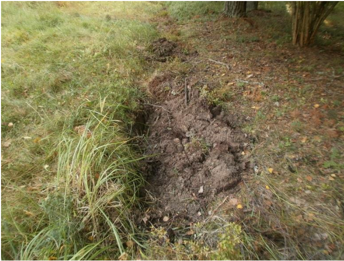
Bild 4. Nedre ändan på dräneringsrören eftersöktes med spade