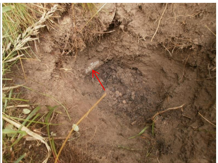
Kuva 7a-b. Piilotettu salaojaputki ojassa nro 1