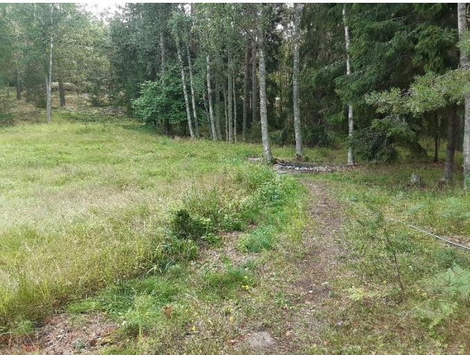
Bild 9. Terrängförhållandena på fastigheten (bilden tagen 19.8.2022)