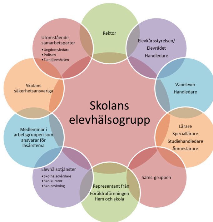
Bild 3. Exempel på den skolvisa elevhälsogruppens sammansättning.

Rektor eller biträdande rektor/vicerektor fungerar som ordförande för elevhälsogruppen och gruppen består förslagsvis av: