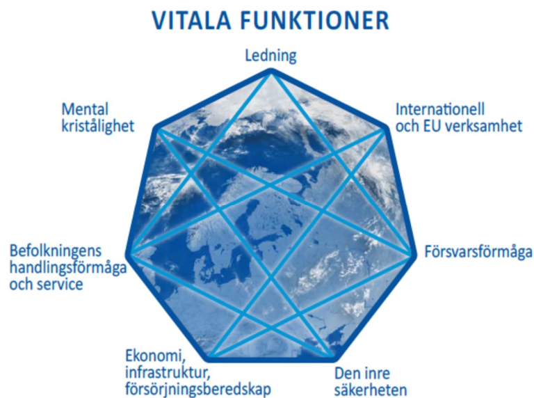
Bild 3. Samhällets vitala funktioner

Den uppdaterade utgåvan av Säkerhetsstrategi för samhället (YTS), som publicerades av statsrådet 2.11.2017, ligger till grund för den gemensamma beredskapen och krisledningen för alla aktörer i samhället https://www.turvallisuuskomitea.fi/sv/sakerhetsstrategi-for-samhallet/ . I strategin beskrivs sju vitala samhällsfunktioner som ligger till grund för beredskapsplaneringen.