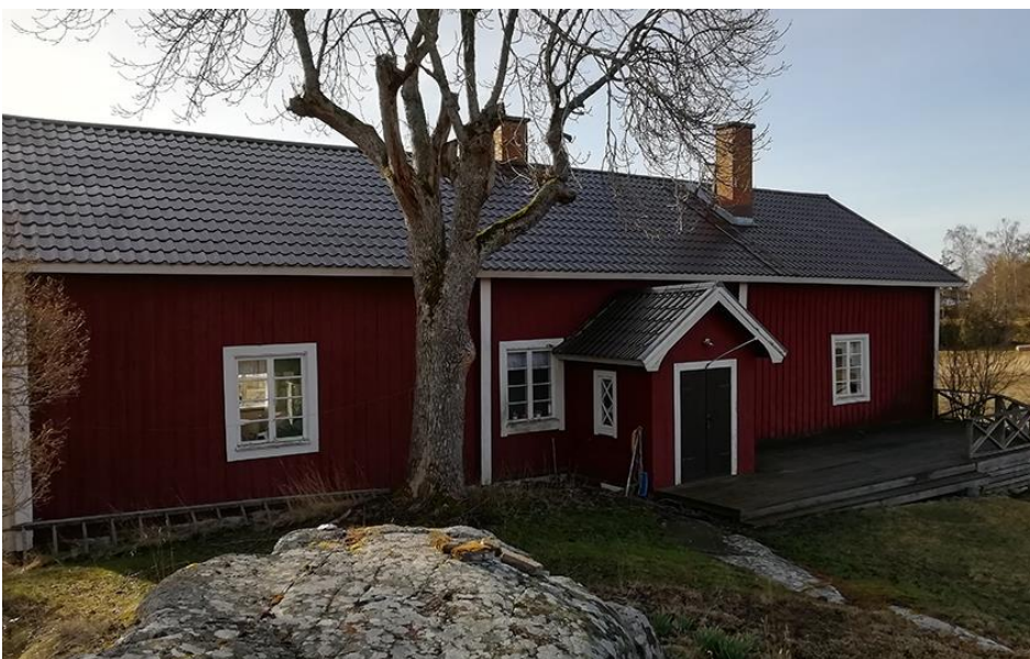
Bild 6. Huvudbyggnaden på Södergård, nr 11 på kartan.