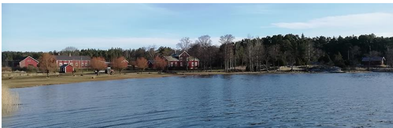
Bild 20. Strandlandskapet i byn från Södergårds tröskhus till vänster till landhuset vid förbindelsebryggan till höger.