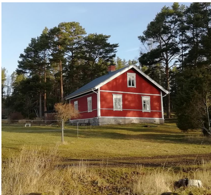
Bild 14. Bostadsbyggnad nr 23 på kartan.