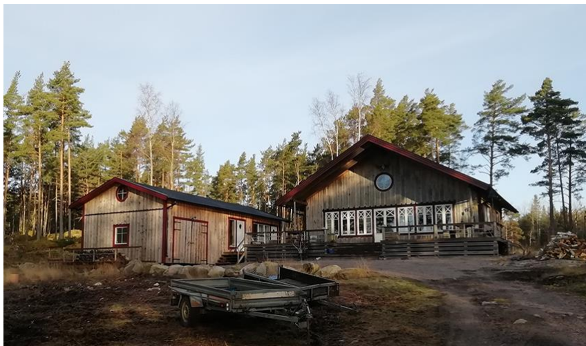
Bild 13. Fritidsbostad (21) med uthus (22) representerar den enda egentliga nybyggnationen i byn på långa tider.