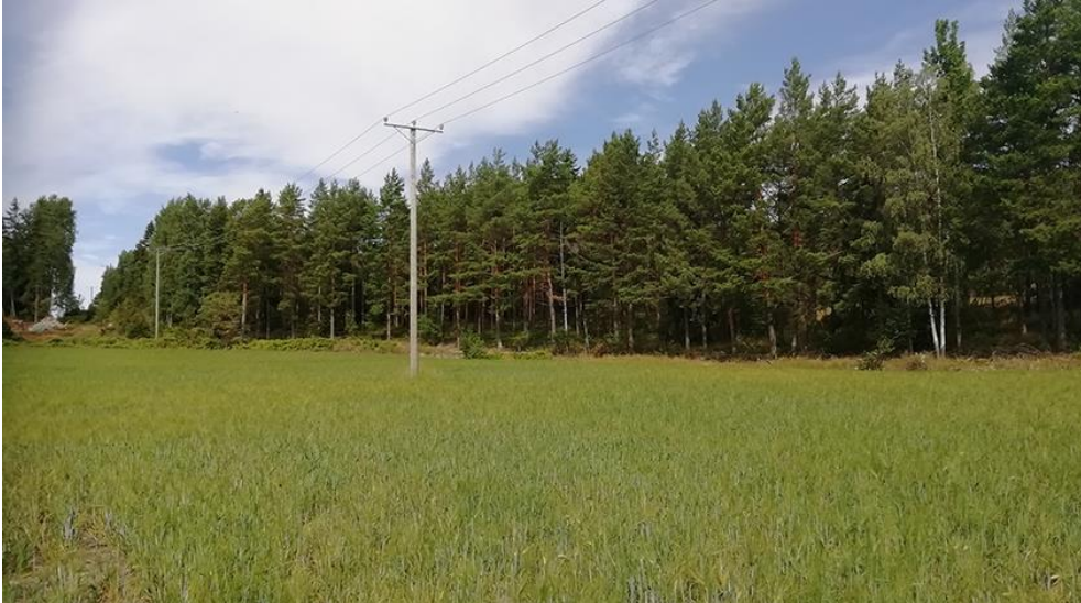
Bild 24-25. Åkerlandskapet mellan kvarteren 7-9. Den övre bilden på östra sidan, den nedre på den västra. Byggnadsplatserna kring åkern är placerade in i skogen så att det öppna landskapet bevaras. Högspänningsledningen kommer vid tillfälle att ersättas med jordkabel.