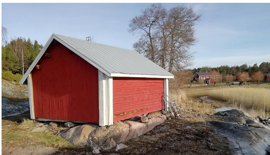
Bild 12. Strandbod nr 16.