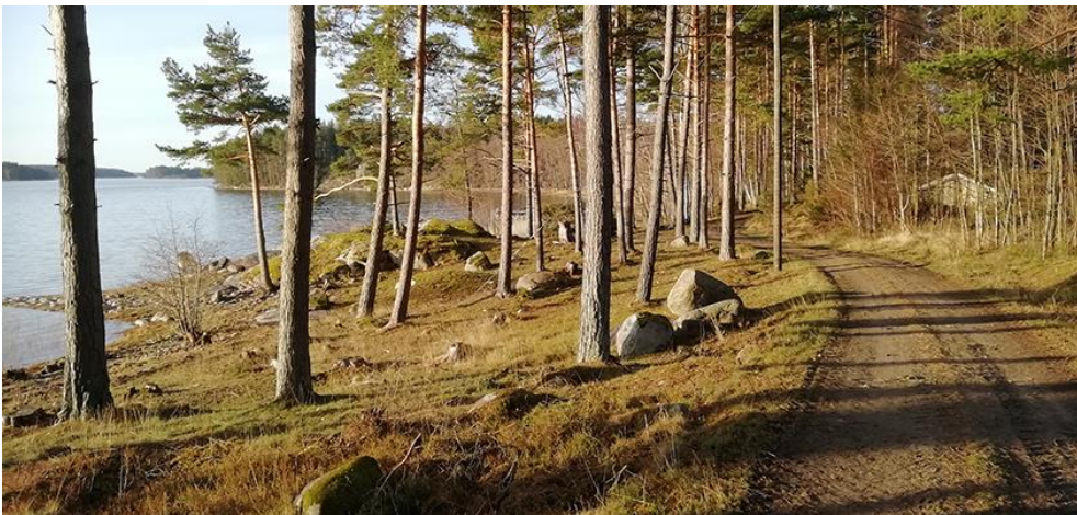
Bild 26. Vägen mellan kvarter 9 och stranden.