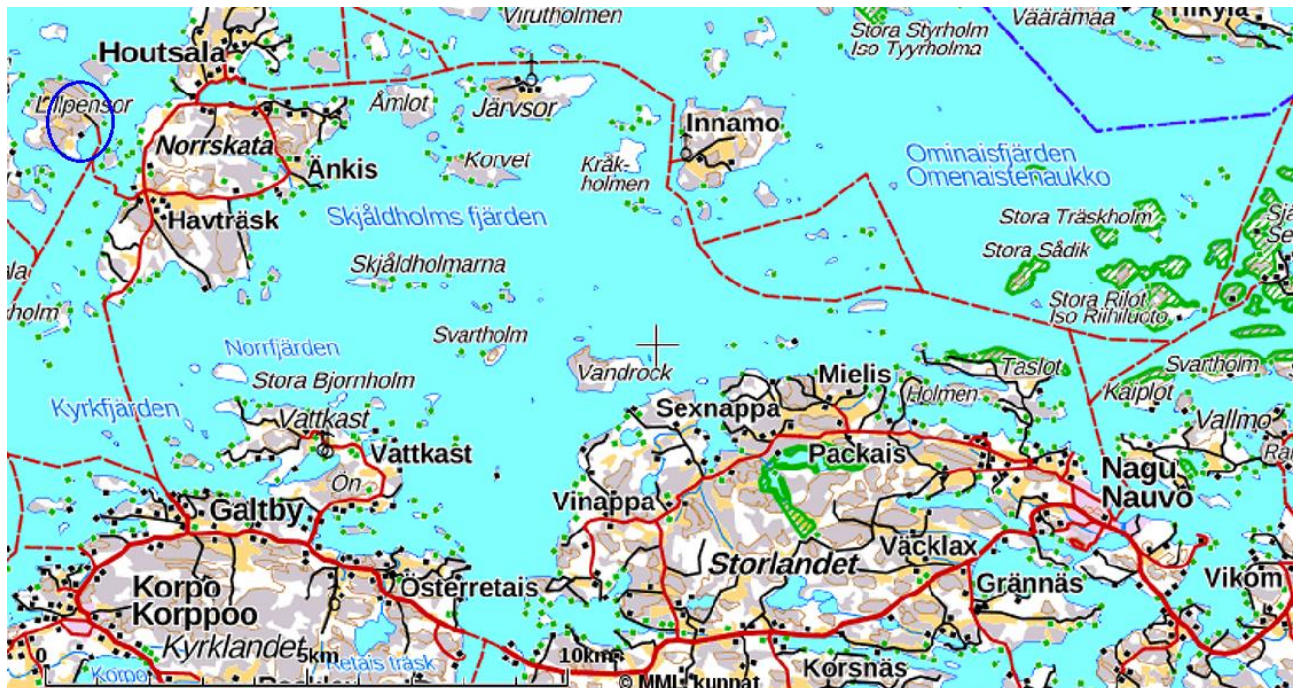
Karta 1. Korpo-Pensar stranddetaljplaneområde ligger väster om Norrskata (blå ring uppe till vänster).

för fastigheterna Marieborg RNr 1:4 (445-636-1-4) och Sandkil RNr 1:43 (445-636-1-43) samt en del av fastigheterna Norrgård RNr 1:3 (445-636-1-3), Södergård RNr 1:36 (445-636-1-33) och det samfällda området 445-636-876-1 i Korpo Pensar, Pargas. Planområdets areal uppgår totalt till ca 93,6 hektar landområden, av vilket ca 75,8 ha ligger utanför den gällande strandgeneralplanen. Strandlinjen uppgår till ca 0,5 kilometer.