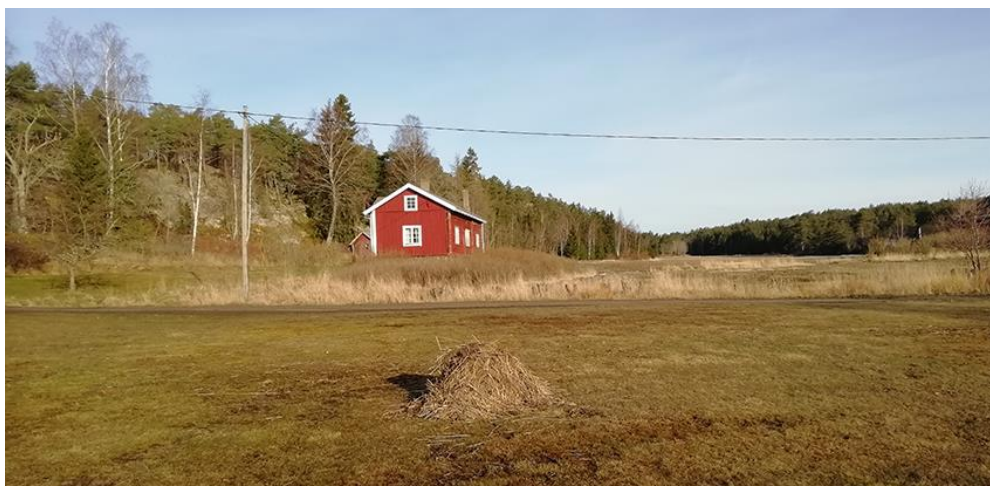
Bild 11. Byggnad nr 19 sett från strandhållet.