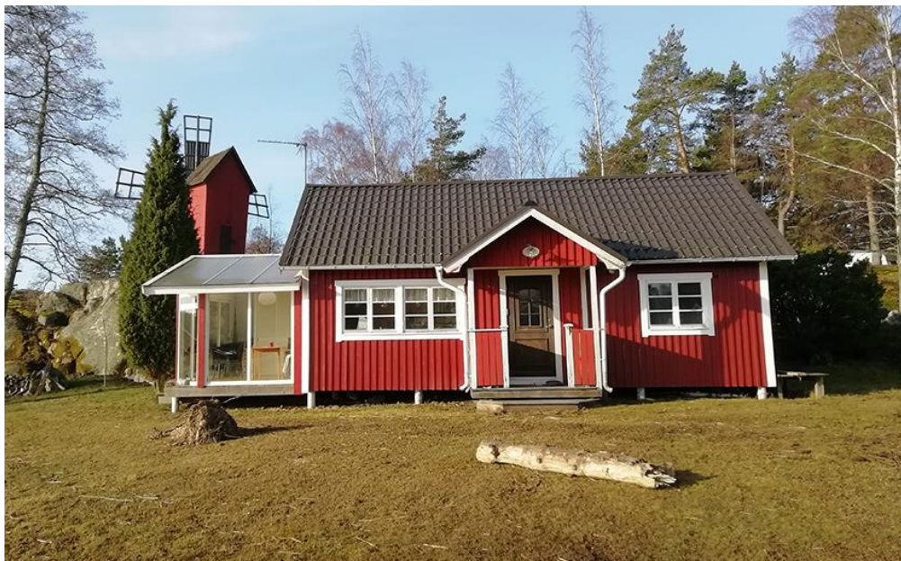
Bild 10. Bostadshuset nr 16 på kartan i närbild.