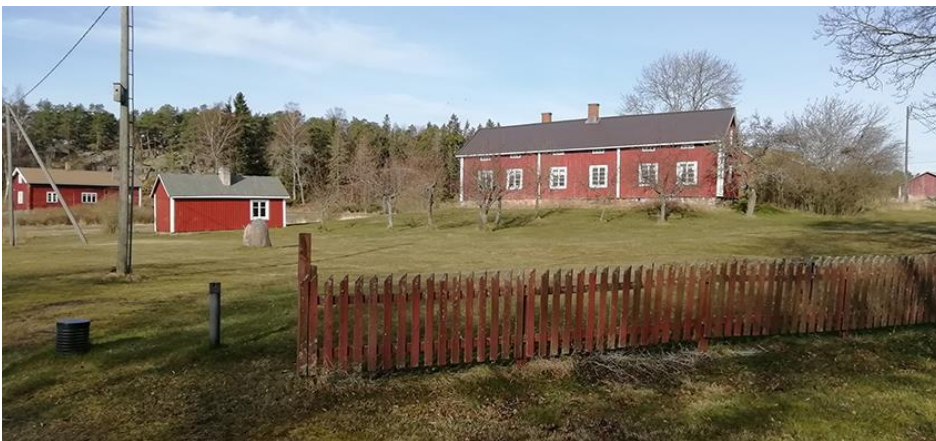
Bild 8. Bostadshus (19), bastu (12) och huvudbyggnad (11) på Södergård. Stängslet markerar gränsen mellan gårdarna.