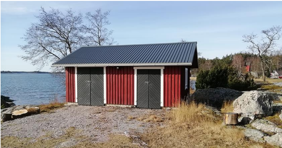
Bild 5. Landhuset vid förbindelsebryggan, nr 10 på kartan.