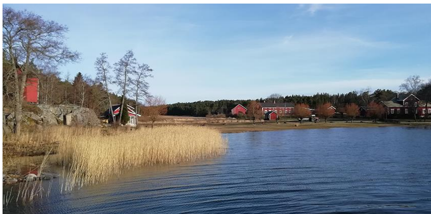
Bild 15. Vy från Södergårds båthusbrygga in mot byn.