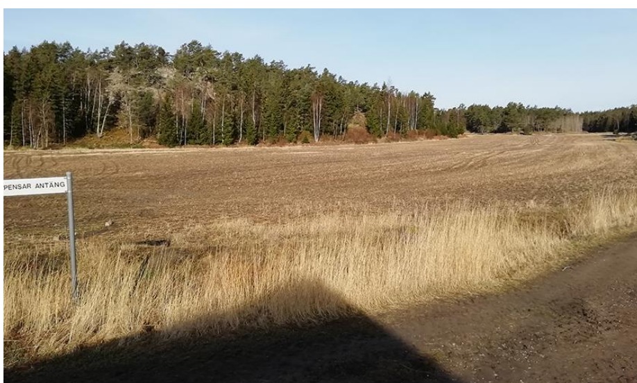
Bild 23. Det öppna landskapet väster om byggnaderna i bycentrum förblir intakt och obebyggt. Skuggan av Södergårds tröskhus förtäljer fotografens placering. Gatunamnskyllningen har tagit sig långt ut i skärgården.