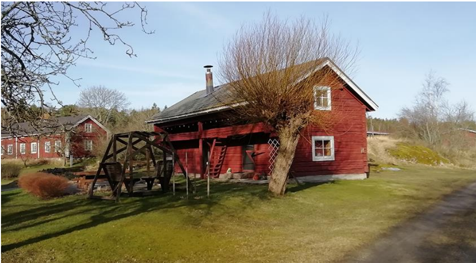
Bild 2. Loftet på gårdstunet, bild nr 5 på kartan.