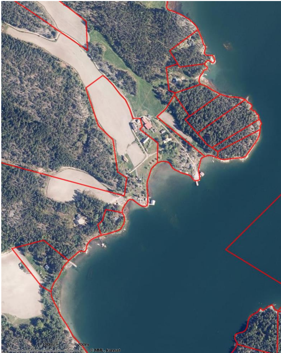
Karta 2. Områdets fastighetsindelning