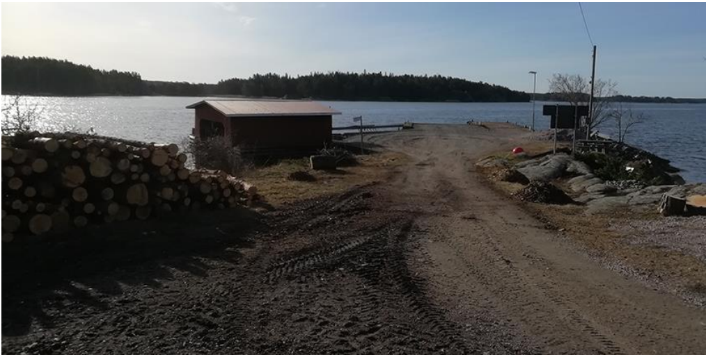
Bild 4. Förbindelsebryggan med båthus, nr 9 på kartan.