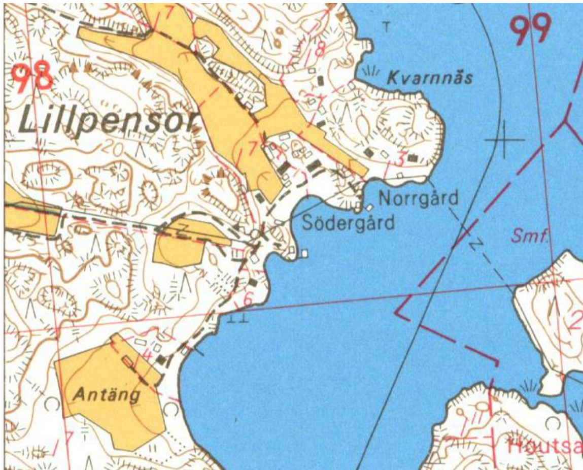
Karta 3. Enligt Lantmäteriverkets grundkarta från år 1968 fanns det vid den tiden 5 bostadshus inom stranddetaljplaneområdet. Några fritidshus har sedan dess tillkommit. Ett antal uthus har rivits.

Planområdets byggnadsbestånd framgår av nedanstående förteckning och karta samt bildserie.