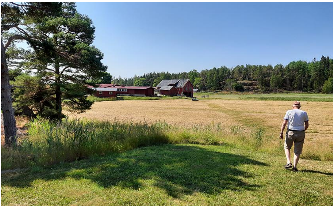
Bild 19. Husbonden på Norrgård stegar in mot gårdscentrumet.