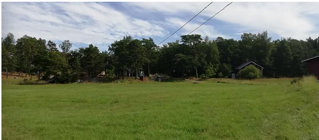
Bild 21. Ängslandskapet från gårdscentret österut. Huset som skymtar mellan tallarna är beläget på planens byggnadsplats 1 i kvarter 2.