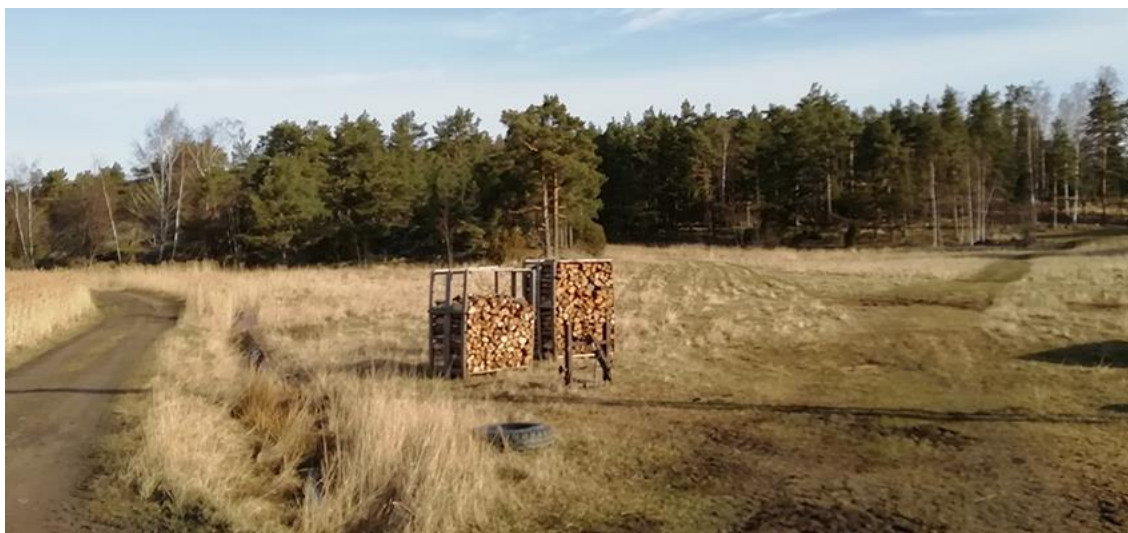
Bild 22. Från skogskanten bakåt på bilden ligger de två byggnadsplatserna i kvarter 4 i planen.