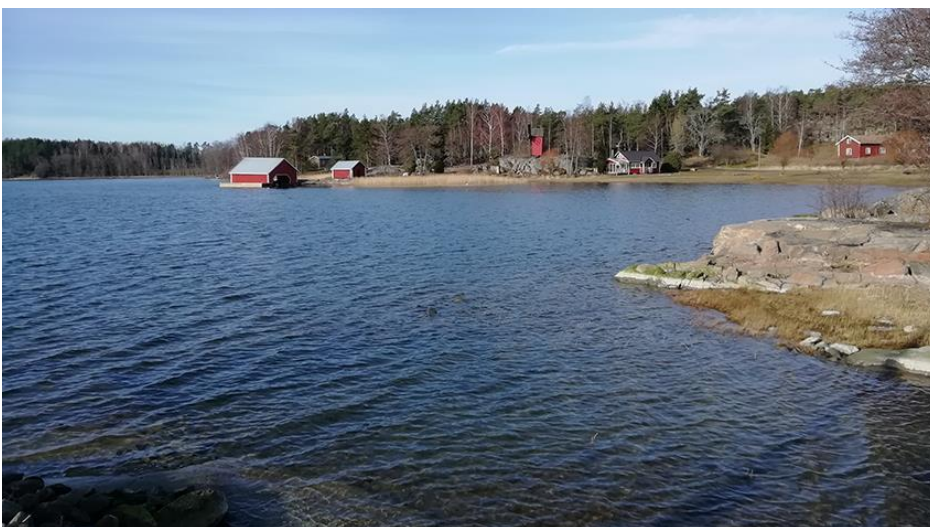
Bild 9. Södergårds båthus (15), strandbod (16) och två bostadshus (18, 19).