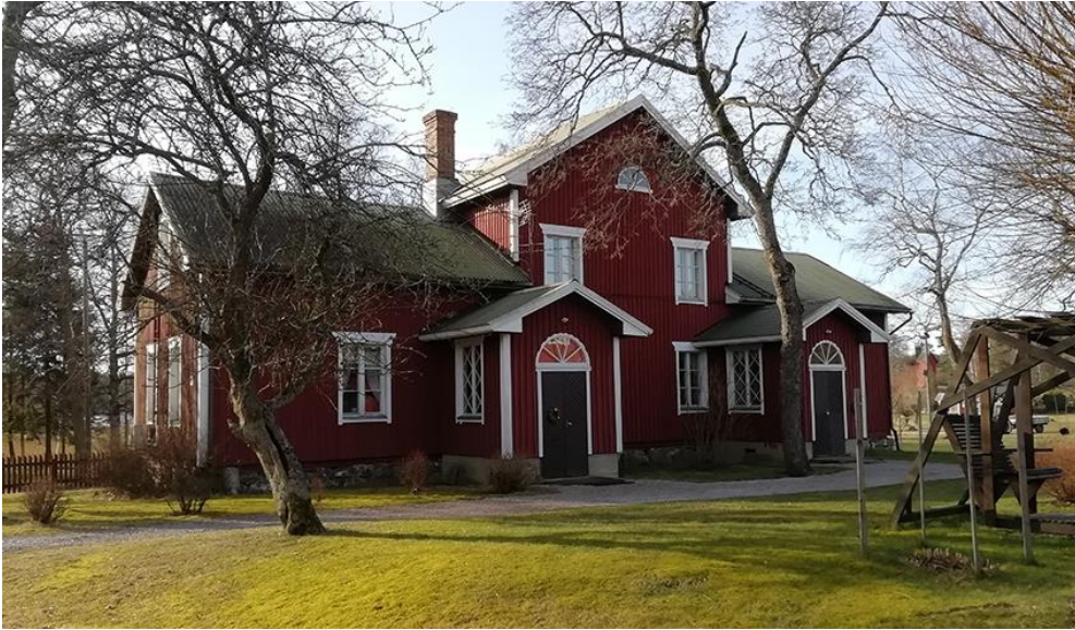
Bild 1. Norrgårds huvudbyggnad, nr 4 på kartan.