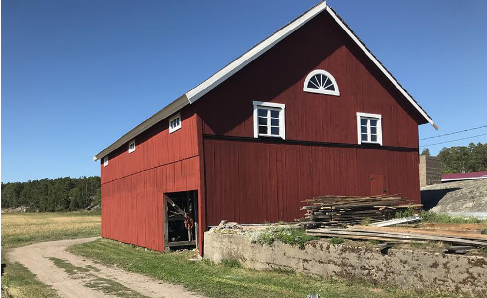
Bild 7. Södergårds tröskhus, nr 13 på kartan.