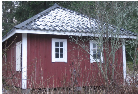
4a?? Kuuluuko tänne??